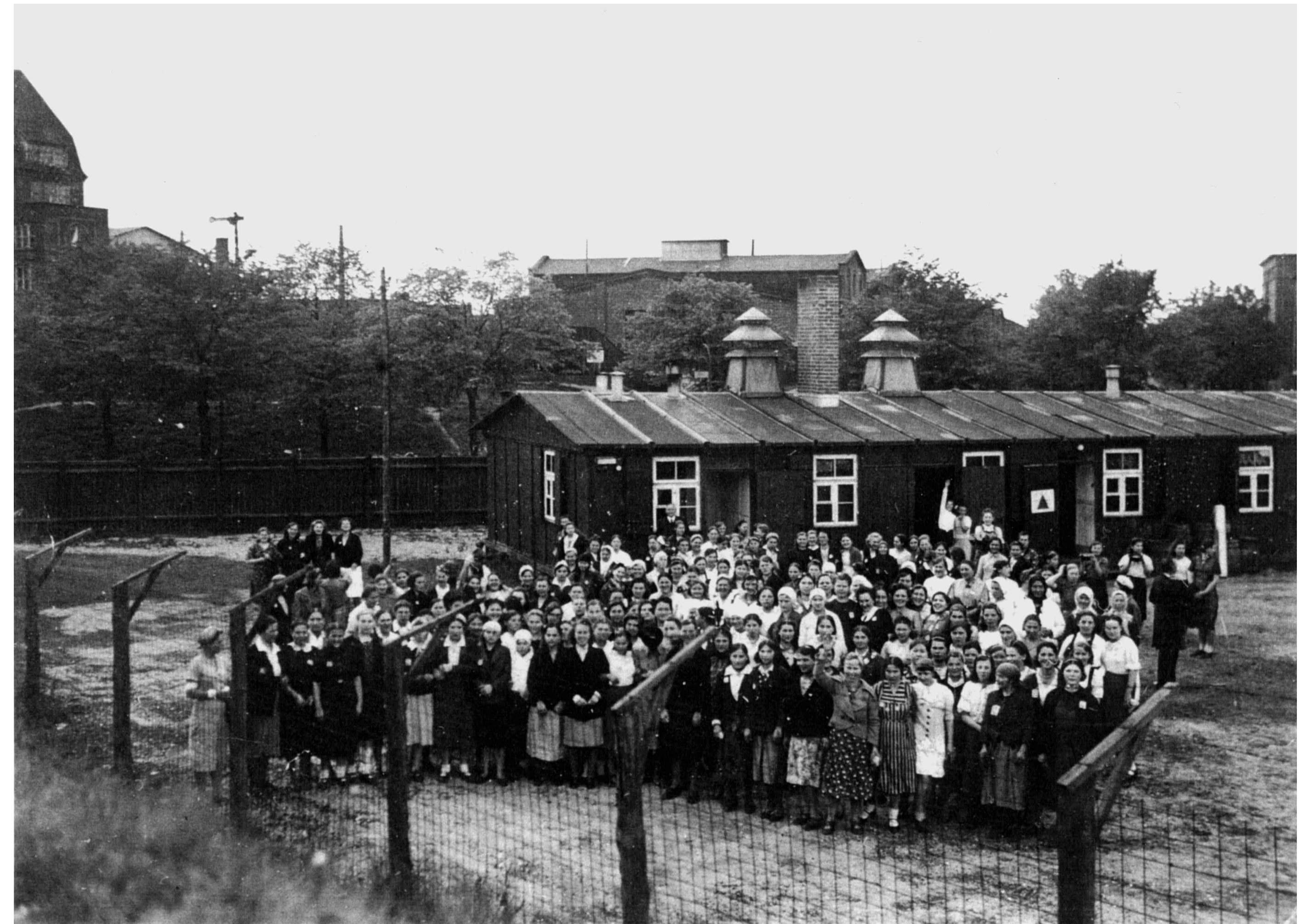
1 Vor der Wirtschaftsbaracke des Frauenlagers. Das Foto entstand vermutlich 1945, nach der Befreiung durch die britische Armee.

Weitere Hinweise: Stadtteilarchiv Ottensen, Tel. 390 36 66