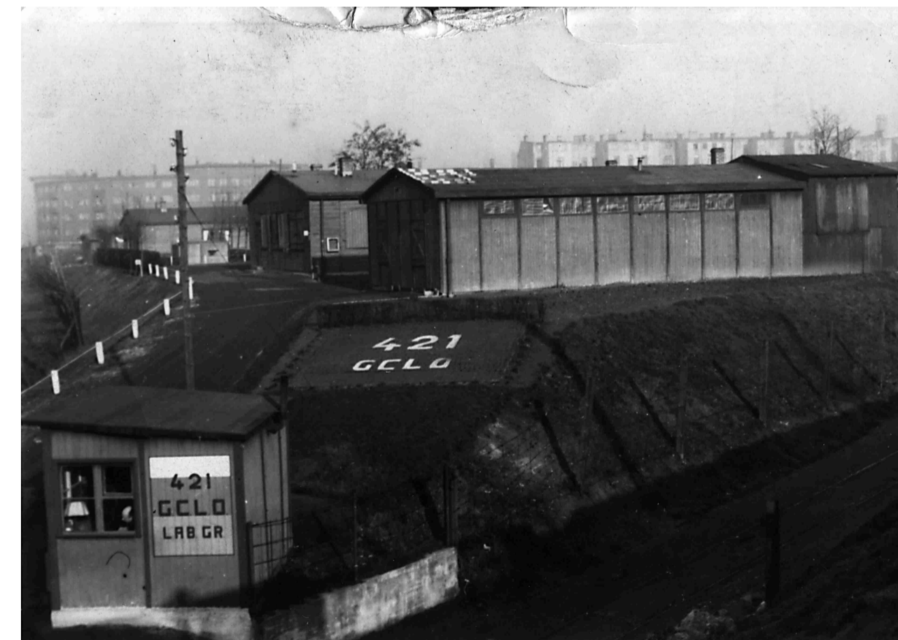
2 Bildpostkarte des Flüchtlings- und Obdachlosenlagers 1949. Handschriftlicher Text auf der Rückseite: „Unser Lager in Hamburg-Altona, Moortwiete 46, Altona den 8. 4. 49“. Im Hintergrund ist der Bahrenfelder Steindamm zu erkennen.