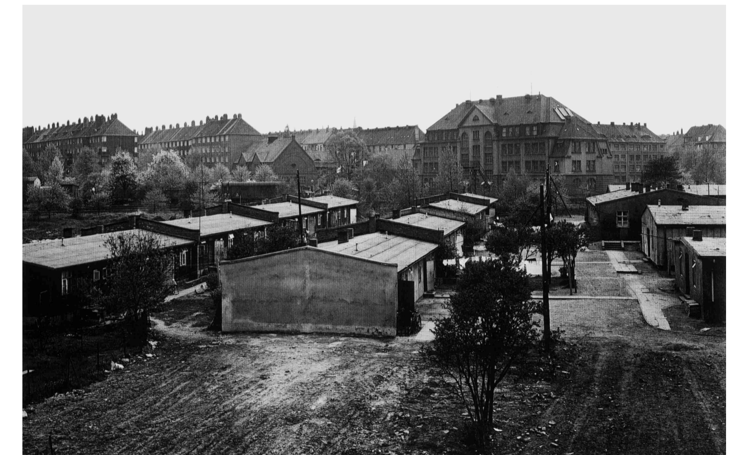
3 Das in Richtung Sportplatz mit Notunterkünften erweiterte ehemalige Männerlager 1960/61. Im Hintergrund sieht man das Schulgebäude in der Daimlerstraße.